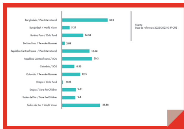
Figura 2: % de cuidadores con conocimientos sobre conductas de cuidado y protección (indicador 2) por socio y país.

En cuanto al conocimiento de los riesgos para la protección de la infancia, los niños conocían menos de dos de los cinco riesgos relevantes a nivel local por término medio. Los niveles de conocimiento parecían ser mayores en el caso de ChildFund Burkina Faso, Aldeas Infantiles SOS Colombia y Save the Children Etiopía. Alrededor del 23, 21 y 17 por ciento de los niños encuestados en estos países fueron capaces de enumerar al menos tres riesgos de protección infantil relevantes a nivel local. Por el contrario, los niveles fueron especialmente bajos en Sudán del Sur (0,0 por ciento), lo que indica que no había conocimiento alguno sobre los riesgos de protección relevantes a nivel local.