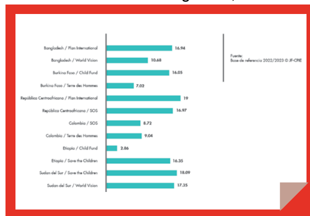
Figura 3: % de miembros de la comunidad capaces de prevenir y responder a los riesgos de protección de la infancia (indicador 3) por socio y país.

Además, dentro de los comportamientos parentales autodeclarados no parecían existir diferencias de género, con una