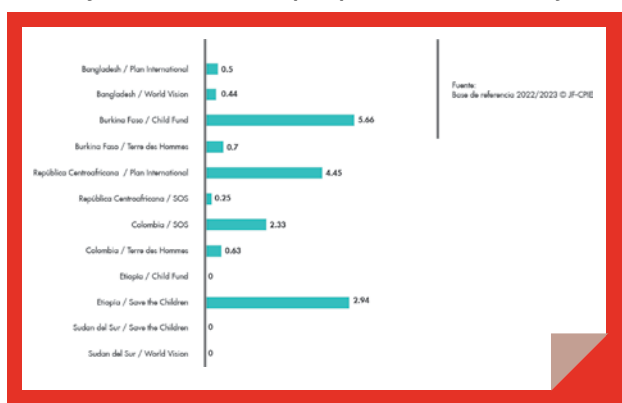
Figura 1: Porcentaje de niños que conocen los riesgos de la protección infantil y cómo mantenerse a salvo (indicador 1), por socio y país.

El gráfico 1 presenta los valores de referencia del indicador 1 expresados como porcentajes de niños conscientes de los riesgos de la protección infantil y de cómo mantenerse a salvo. Los valores de referencia entre los 4.758 niños encuestados (edad media entre 10,4 y 14,0 años; proporción de mujeres